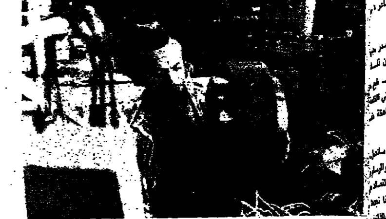
عمال غزة في مصنع لآلات الكروماتية في المنطقة الصناعية في غزة